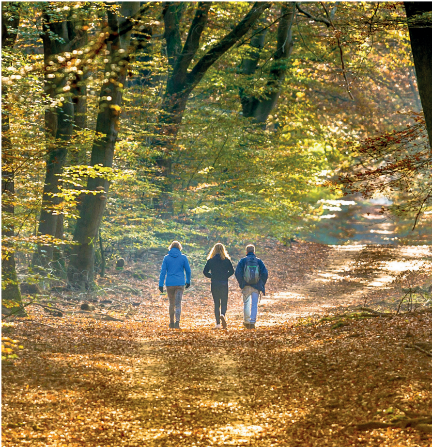
Klassische Bewerbungsgespräche sind out. Ob die Sympathie, gefühlte Nähe und Komplizenschaft bei Kandidat*innen passen, lässt sich bei einem Waldspaziergang oder einem Bier in einer Bar viel besser herausfinden.

die Disco oder in den Escape-Room. Zu den neuen Gepflogenheiten des Rekrutierens gehören Arbeitsproben, um weniger Risiken einzugehen, die falsche Person einzustellen. Lieber setzt man etwas Geld für einen misslungenen Workshop in den Sand, als eine für beide Seiten unglückliche und kostspielige Beziehung einzugehen.